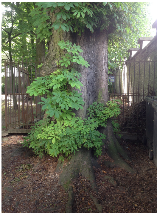
Marronnier commun, Jardin Jean Félix Hap