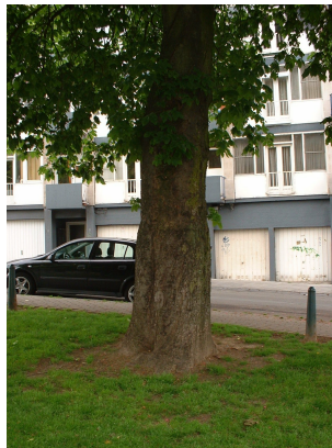
Marronnier à fleurs rouges,