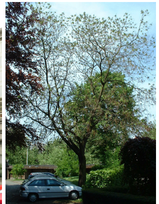
Catalpa rougeâtre, Parc du collège Saint-Michel